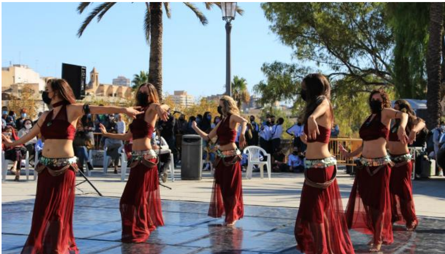
Dansa oriental en 2020 MOSTRA VIVA

La Mostra Viva del Mediterrani celebrarà el seu Aplec de Dansa amb una "visió social" amb l'objectiu de reforçar l'art com a "instrument per a la inserció de col·lectius en risc d'exclusió". Així, la trobada comptarà amb actuacions de grups de dansa integrats per persones amb diversitat funcional i especialitzats en cultura inclusiva.