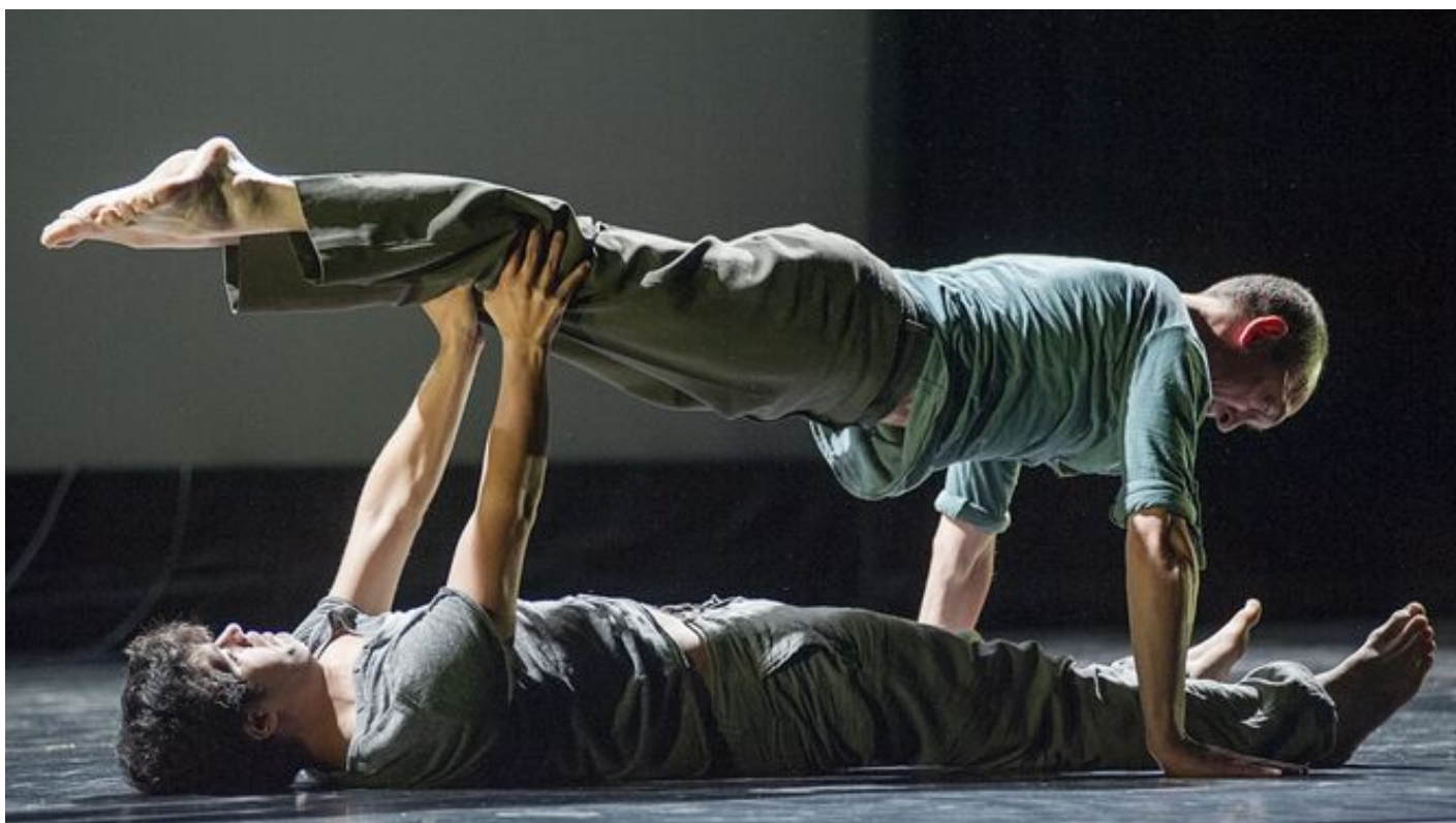
Una coreografía de la compañía Danza Mobile.