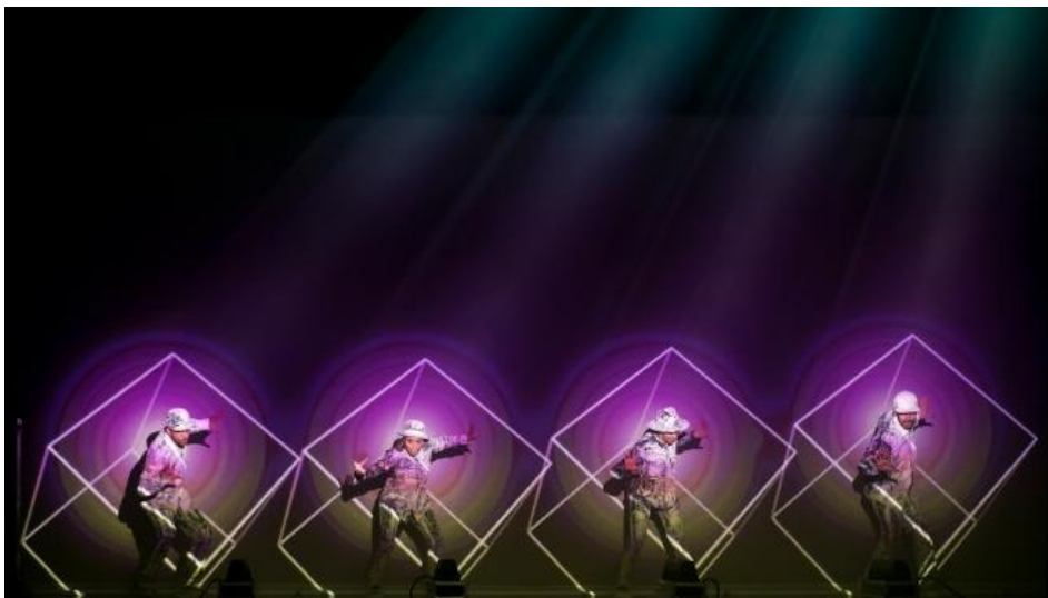
Imagen de uno de los espectáculos de Danza a Escena DANZA A ESCENA

'Danza a Escena', el circuito de impulso a la danza promovido por el INAEM y desarrollado por La Red Española de Teatros, Auditorios, Circuitos y Festivales de titularidad pública, regresará un año más a los teatros de la Región de Murcia.