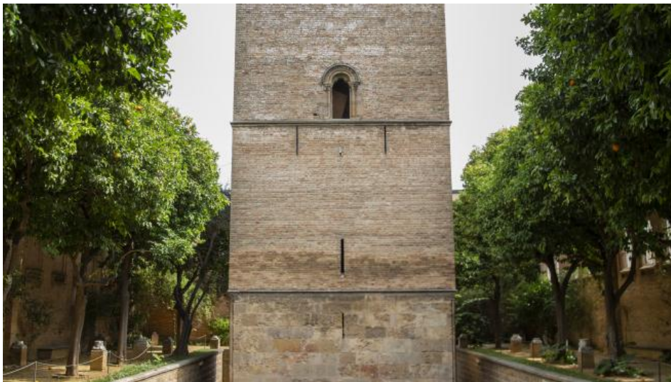
Espacio Cultural Santa Clara María José López

El ciclo 'Noches en la Torre de Don Fadrique' llega esta semana a su ecuador con nuevas propuestas artísticas que tendrán como escenario el exterior del Espacio Santa Clara y que se desarrollarán entre los días 15 y 19 de septiembre.