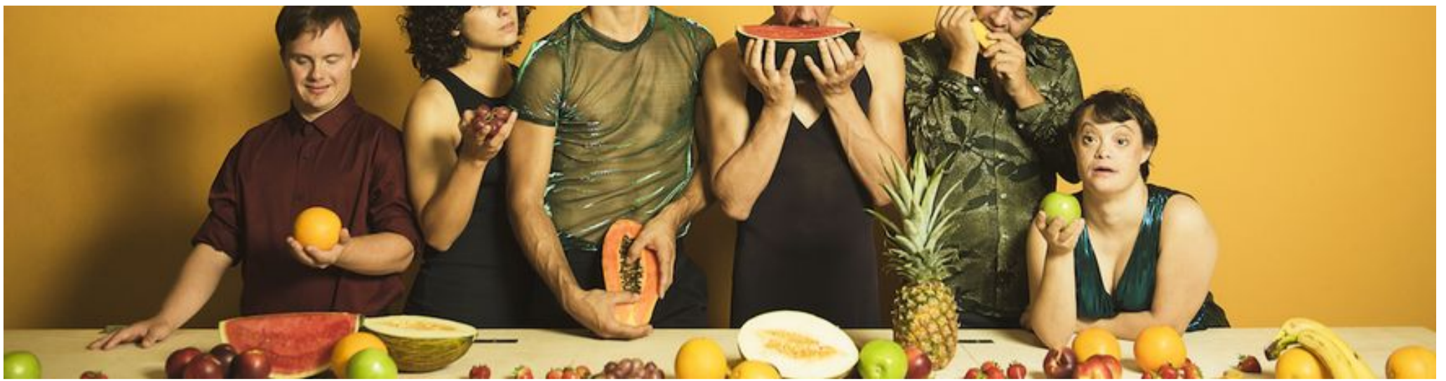
'El festín de los cuerpos'

'El festín de los cuerpos' de Danza Mobile, viernes 25 de septiembre