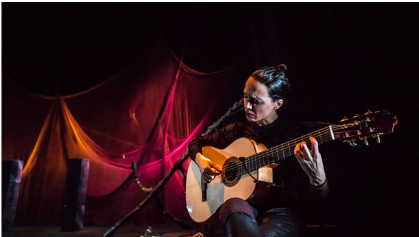
El espectáculo Órbita / E.S.

REDACCIÓN Tarifa, 20 Agosto, 2020 - 13:04h