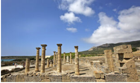
El conjunto arqueológico Baelo Claudia de Bolonia. / E.S.