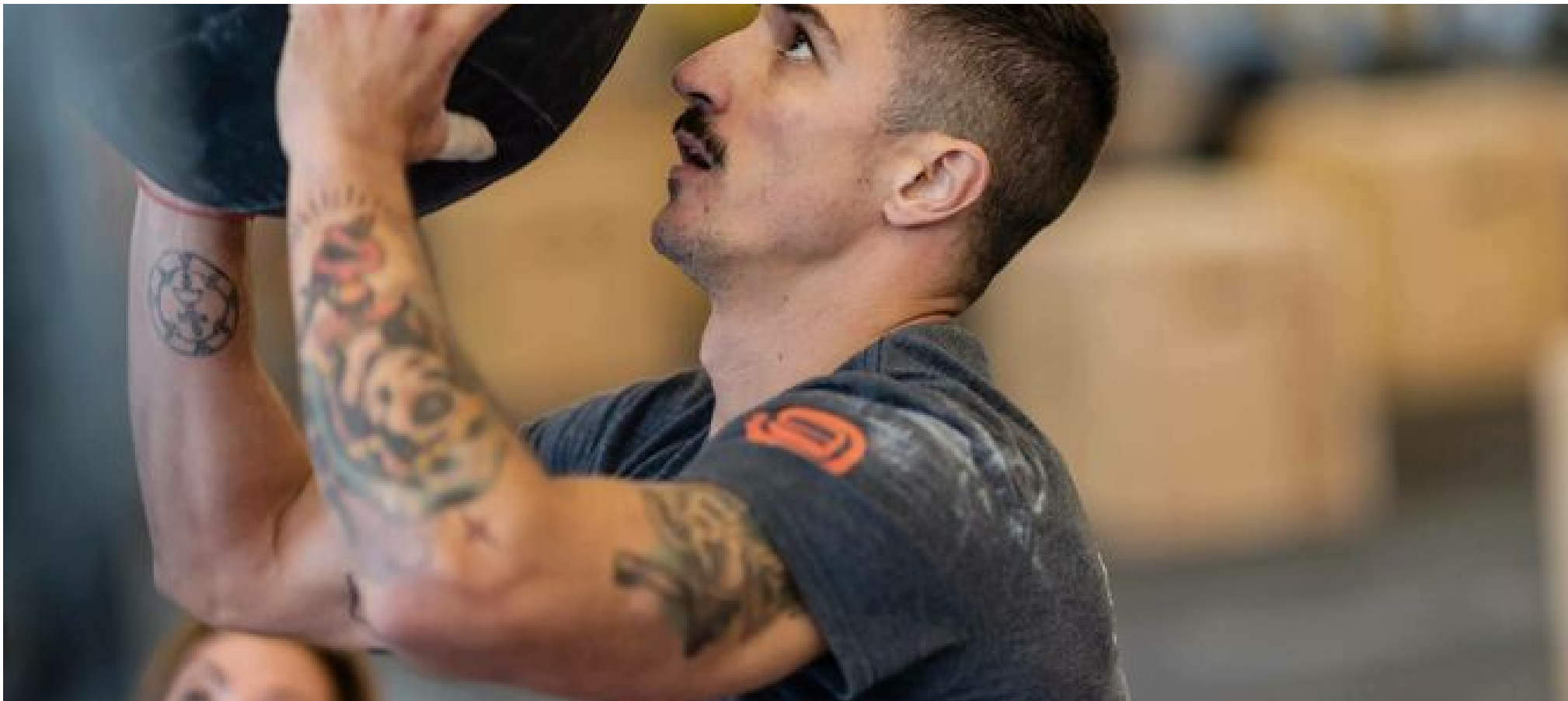
Uno de los participantes de la edición de 2018, durante la ejecución del conocido como 'wall ball shots'. / M.G.