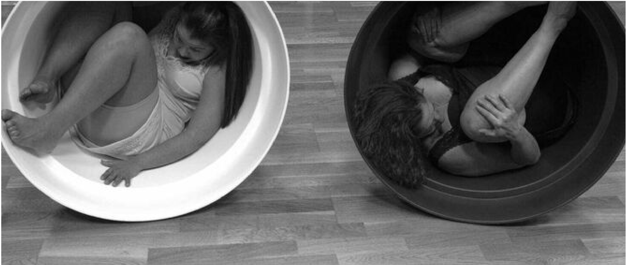
Danza inclusiva para las noches del FEX