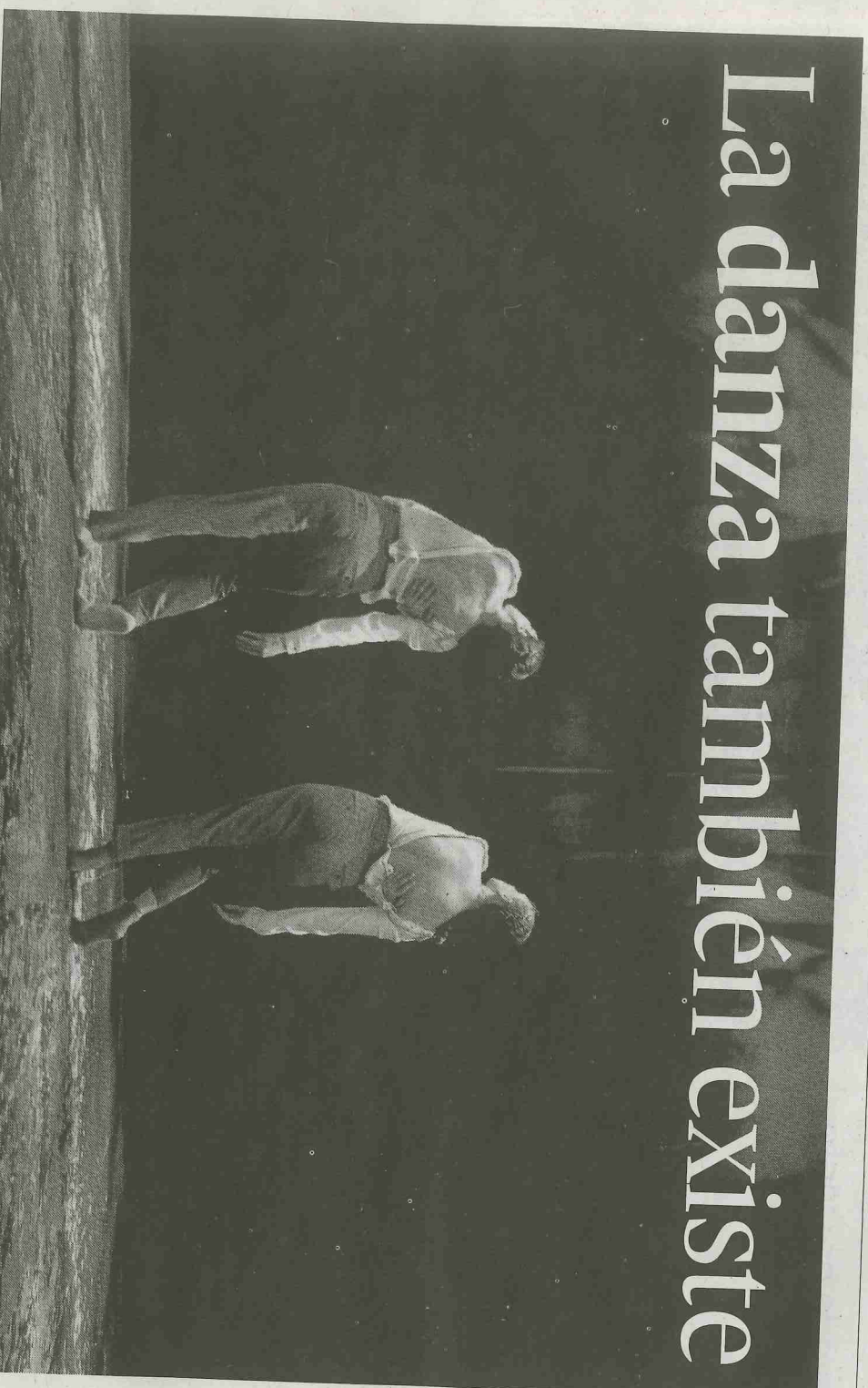
La compañía sevillana Habermas Haylas en un momento de su coreografía corta 'Arjé'.

Rosalía Gómez SEVILLA Los avatares de la política han querido que hoy sea un día crucial para la vida de los españoles. Pero hoy, además, se celebra el Día Mundial de la Danza, una disciplina cuyo respeto y apoyo, junto al resto de las artes escénicas y a otras expresiones culturales —que no lo olviden los futuros gobernantes— constituye el termómetro que mide la buena marcha de un país.