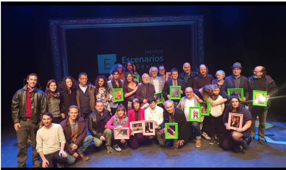
Todos los galardonados en los Premios Escenarios de Sevilla.

EL CORREO / SEVILLA / 28 NOV 2018 / 08:17 H - ACTUALIZADO: 28 NOV 2018 / 08:43 H.