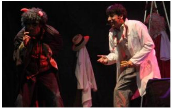
La obra Otra vez Fausto será una de las que se representen en la

el jazz, el cine, el rock y la guitarra, ahora llega el turno de las artes escénicas, con la tercera edición de Fitelx. El festival dará comienzo mañana por la tarde, con la representación en el Gran Teatro de la obra Aquí no paga nadie , a cargo de miembros de la Asociación Cultural Fitelx. La entrada cuesta siete euros y se puede adquirir en la web instanticket.es o a través de la propia taquilla del Gran Teatro.