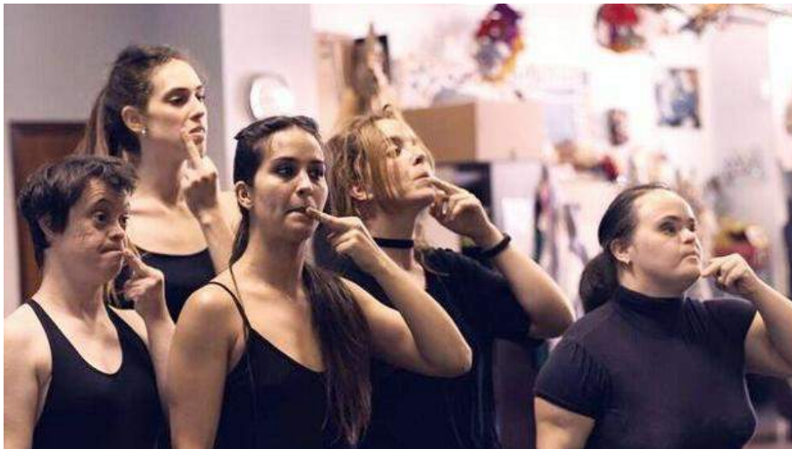
Danza Mobile, las artes escénicas como vía de comunicación de la diversidad

● Desde hace veintitrés años trabajan en Sevilla con bailarines con discapacidad intelectual