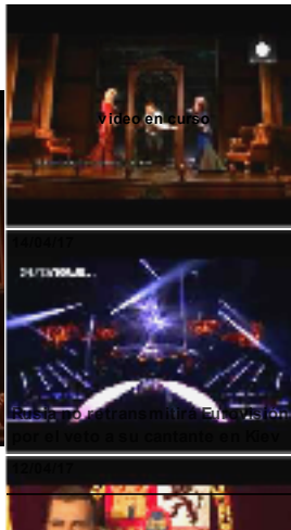
Video Smart Player invented by Digiteka