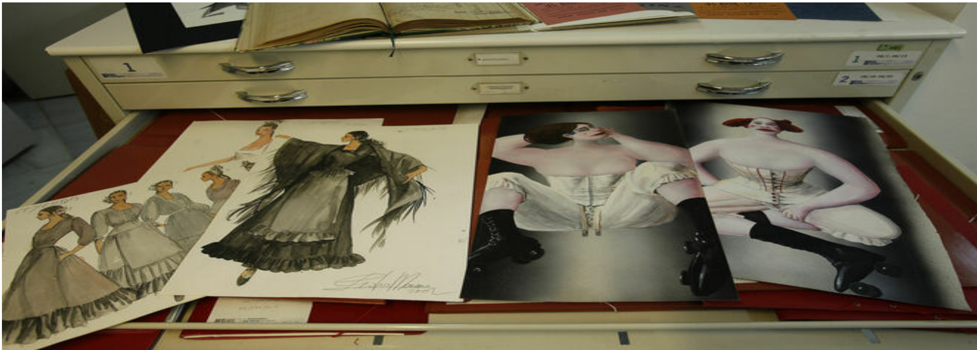
Algunos bocetos históricos de vestuarios empleados en obras teatrales.