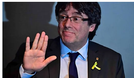
Los argumentos esgrimidos por Llarena...