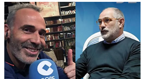
2ª parte, El Partidazo de COPE (10-05-2018)