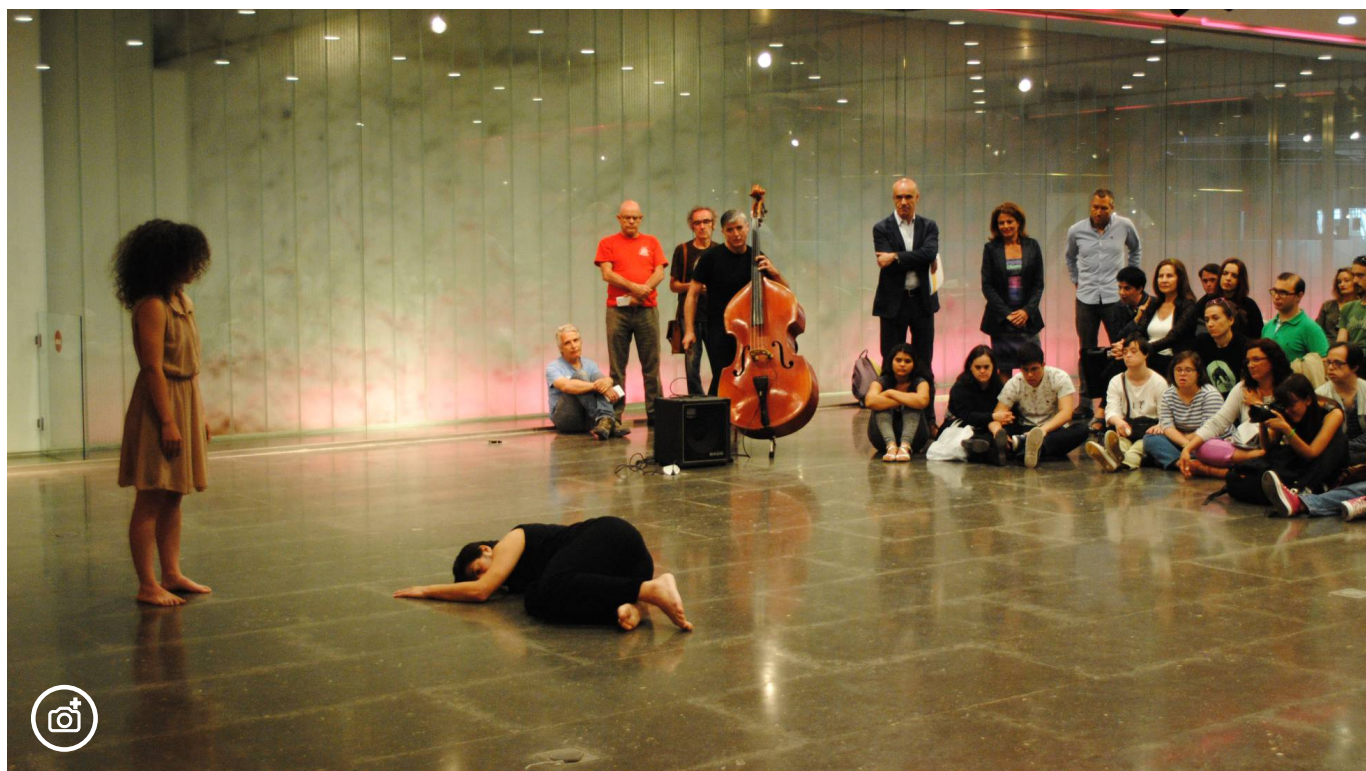
Un momento de la performance 'Curiosos', durante la presentación del festival.