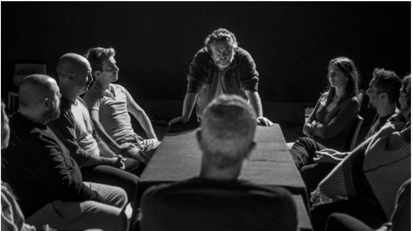
Imagen de 'El jurado', la producción de Avanti Teatro. / D.C.