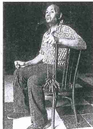
Las muestra, que abrió al público en la nueva sede de la galería la pasada semana, incluye 22 fotografías en blanco y negro con retratos de diferentes personajes y fueron tomadas entre los años 1982 y 2000.