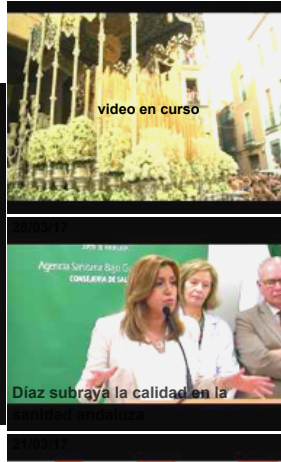
Video Smart Player invented by Digiteka